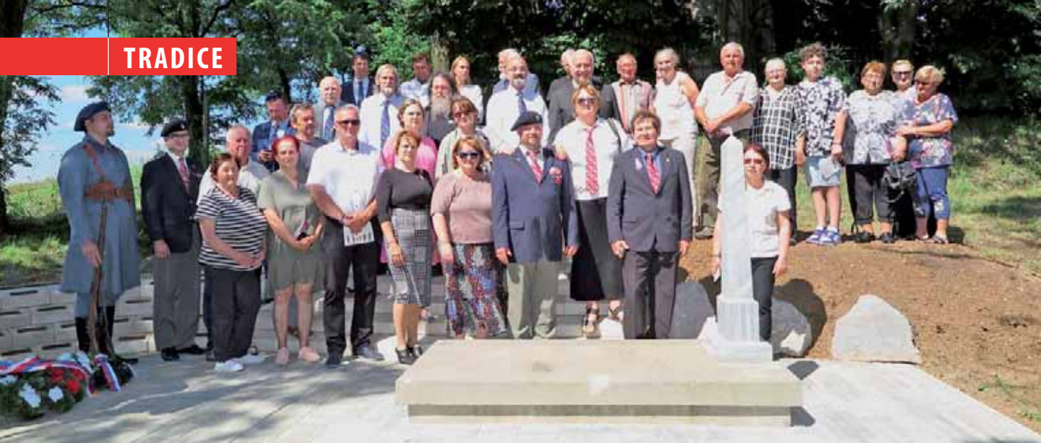
Po slavnostním odhalení pomníku v Lenke jsme se s místními obyvateli nechali na památku vyfotografovat