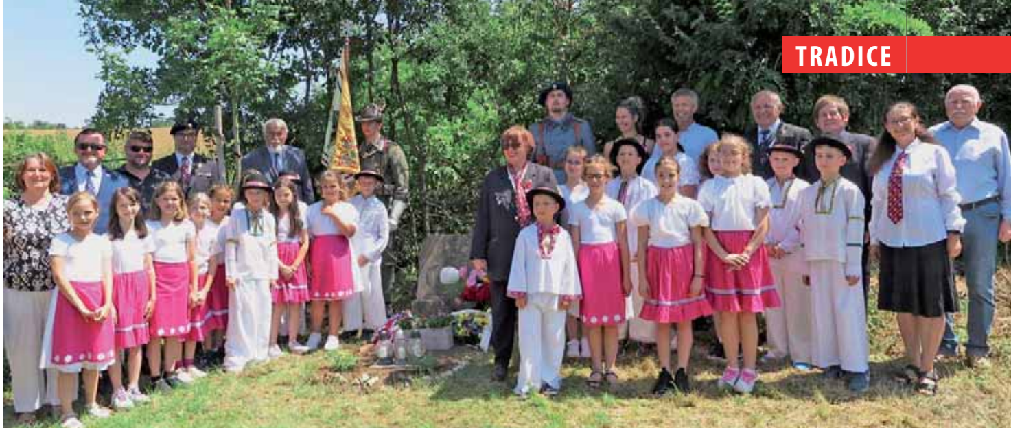
Památeční snímek s dětmi ve Velkom Lapáši po dojemném pietním aktu na místním hřbitově

Poslední pieta se odehrála u nového pomníku sedmi čs. vojáků pohřbených v Dekyši. Nejnáročnější výstup celé vzpomínkové pouti, ačkoliv byl stanoven jako dobrovolný, zvládli v horkém letním dni všichni účastníci. Společně jsme se tak i se zástupci obce poklonili památce padlých čs. vojáků, kteří v tomto případě pocházeli z různých míst Českých zemí.