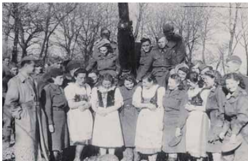
Oslava 1. máje 1944 v Boratíně na Volyňi. Na snímku příslušníci a příslušnice 1. čs. armádního sboru s místními děvčaty v krojích.

P o stažení z první linie v březnu 1944 se 1. čs. samostatná brigáda přesunula na Volyň, kde bylo možné podle předchozí dohody mezi čs. a sovětskou stranou doplnit stavy z řad volyňských Čechů. Jejich nástup lze označit za spontánní, takže klasická mobilizace nemusela být ani zahájena. Je však nutné zdůraznit, že by se