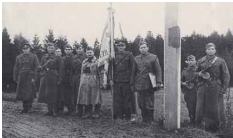
Velitel 1. čs. samostatné brigády brigádní generál Vedral-Sázavský (ve světlém kabátě) u původního čs. hraničního sloupu po dosažení hranice 6. října 1944

na berlínský a vídeňský směr. Postup Rudé armády rovinami Polska a Maďarska by zároveň vážně ohrozil i německé síly v oblasti Karpat, takže by velmi pravděpodobně ani nedošlo k vyčerpávajícím bojům v horském terénu.