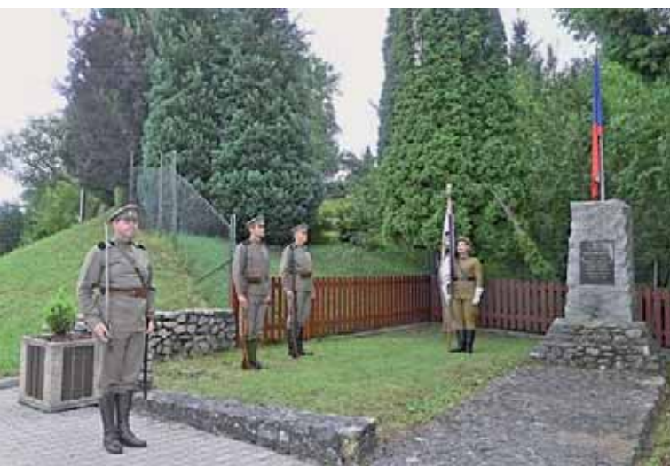
Členové mladoboleslavské jednoty ve stejnokrojích čs. legionářů