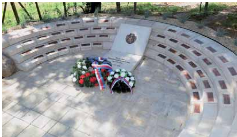
Nově odhalený pomník-kenotaf v Lenke, připomínající čs. vojáky, jejichž hroby se nachází na dnešním území Maďarska

V sobotu 15. června jsme se jedinkrát za celou cestu vydali za maďarskou hranici, a to do Balassagyarmatu, kde jsme na zdejší rozlehlém hřbitově navštívili obnovený pomník zde pohřbeným čs. vojákům. Poté jsme se již na slovenské straně