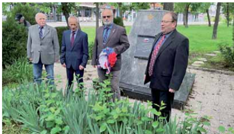
Na základně Film City v Prištině jsme uctili památku všech padlých vojáků mise KFOR.

V letech 2002–2005 byl v Kosovu nasazen nově vytvořený česko-slovenský prapor složený ze dvou českých a jedné slovenské mechanizované roty a rotami velení a zabezpečení v celkovém počtu pět set vojáků. Prostor odpovědnosti byl postupně rozšiřován až na 1150 km 2 a délka administrativní hranice mezi provincií Kosovo a Srbskem dosáhla 104 km. K hlavním úkolům patřily nepravidelné prohledávací operace, kontrola propouštěcích míst, doprovod osob a automobilů, boj s organizovaným zločinem, zvládání demonstrací a nenačatých událostí, výcvik a dohled nad kosovským ochranným