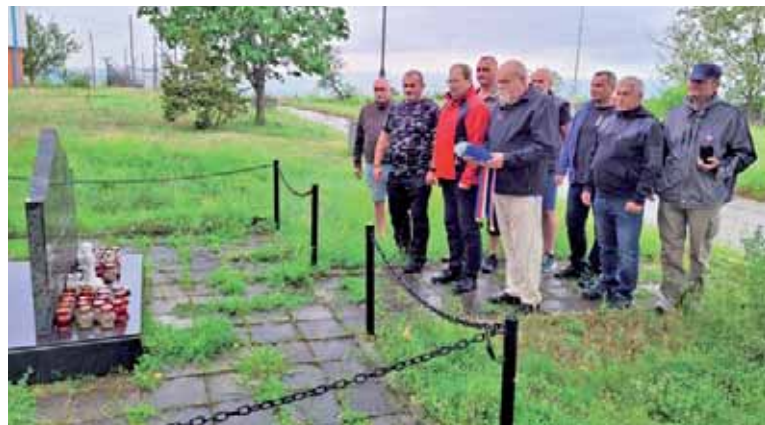
Bývalá základna Šajkovac – uctění památky čtyřiceti dvou obětí letecké nehody slovenského letounu An-24. Slovenští vojáci se 19. ledna 2006 vrátili z mise KFOR zpět domů.

obchody, parkoviště a fotbalové hřiště. I silniční přechod mezi Kosovem a Srbskem byl kompletně přestavěn.