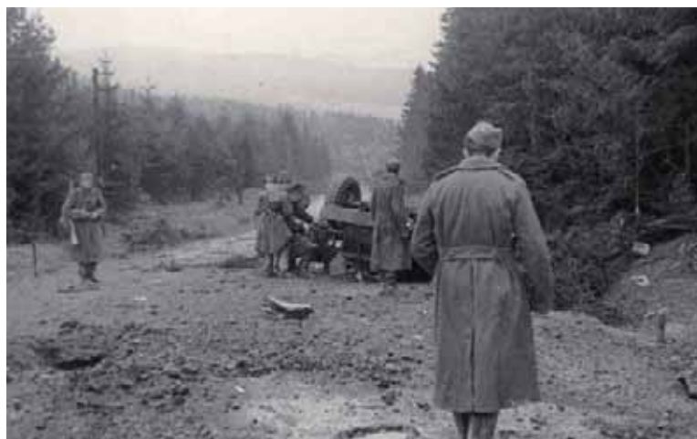
Po zastávce na hranici se generál Vedral-Sázavský vydal za prvosledovými jednotkami. Po několika desítkách metrů jeho vůz najel na minu, přičemž generál zahynul.

Tato nutná podmínka ale nebyla naplněna, protože odpor špatně organizovaných slovenských jednotek se během krátkého období zhroutil a jejich obranná postavení zaujali Němci. Další vývoj také komplikoval aktuální stav 38. armády opotřebované v nedávno ukončených bojích. Ačkoli její sestavu postupně rozšiřovaly další střelecké i tankové sbory, posilovali svoji obranu velmi rychle i Němci. Ti vedle řady pěších jednotek přisunuli i tři tankové divize. Průběh operace se proto hned