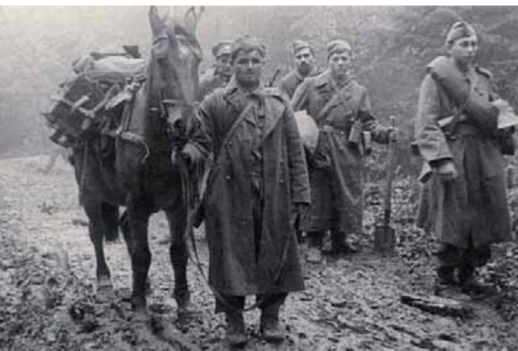
Čs. vojáci postupují náročným terénem k dalšímu karpatskému hřebenu

odvodům nevyhnuli, protože se na ně jako sovětské občany vztahovala povinnost narukovat do Rudé armády. Zpravidla vstupoval do jednotky otec se synem či dcerou, nebo několik sourozenců a zbývající osoby pečovaly o chod rodinného hospodářství. Odhaduje se, že do čs. vojenských jednotek v době války vstoupilo z řad volyňských Čechů přibližně 11 000 osob, včetně více než 400 žen.