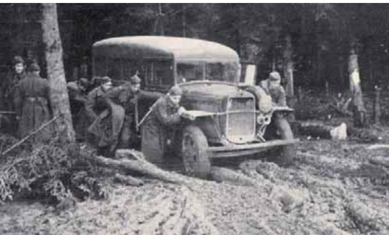
Horské polní cesty se po každém dešti měnily v hluboké bláto, které znesnadňovalo přesun vojákům, hlavně ale jakékoliv technice

propuštění ze sovětských zajateckých táborů, můžeme rozhodně tvrdit, že vznik 1. čs. armádního sboru byl možný jen díky volyňským Čechům.