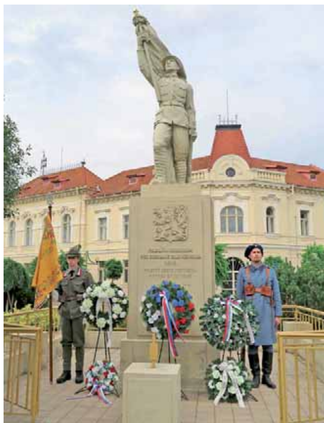
Momentka z piety u sochy italského legionáře v Seredi