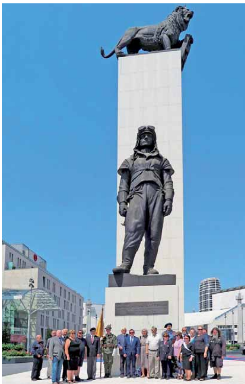
Před monumentálním pomníkem gen. Milana Rastislava Štefánika v Bratislavě

Stejně tak bych rád poděkoval našim dvěma řidičům, kteří nás bezpečně dopravili na zhruba 1500 km dlouhé cestě. Můj dík patří stejně tak všem účastníkům legionářské poutě, protože