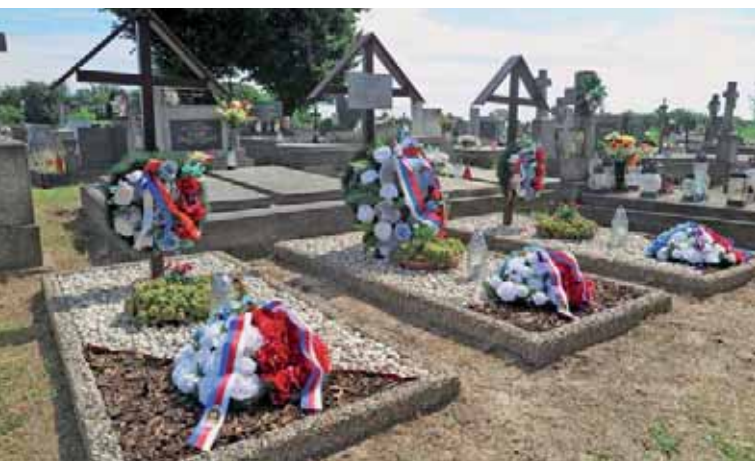
Příkladně upravené hroby tří čs. vojáků v Zaluzičích na východě Slovenska