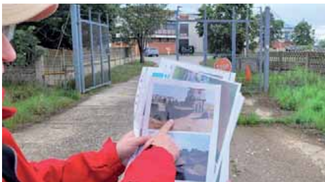
Brána hlavní české základny Šajkovac. Současný stav můžeme porovnat s dobovým snímkem.

Přištinu jsme objeli po dálnici směrem na Podujevo. Projeli jsme okolo bývalé norské základny v obci Lebane. Silnice se postupně měnila na staveniště, protože komunikaci bez uzavírek nebo objížděk rozšiřují na čtyřproudovou. Areál školy v obci Gornji Šibovac byl v červnu 1999 přidělen výše zmíněné 6. průzkumné rotě. Škola je v současnosti opravená a opět slouží svému účelu. Poslední zastávkou prvního dne v Kosovu byl hraniční přechod Gate 3 u obce Merdare. V místech, kde se nacházela česká základna se dnes nachází logistický areál,