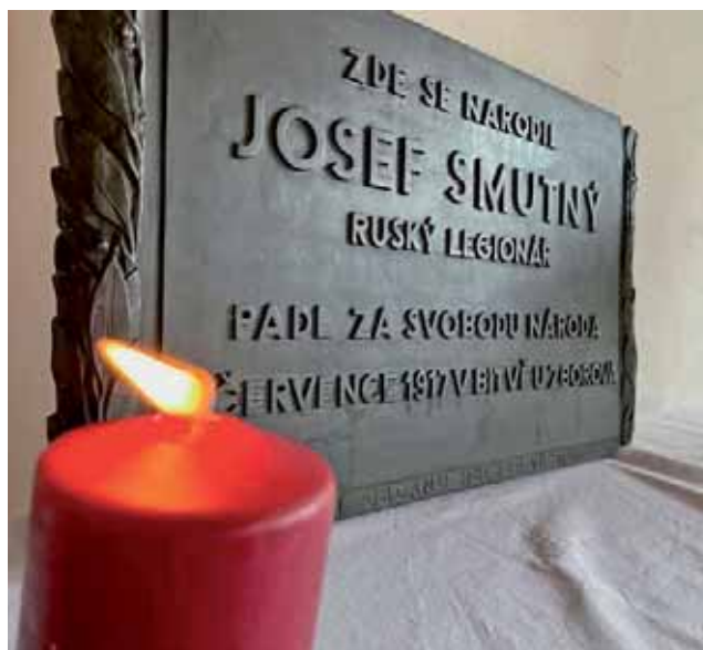
Dochovaný originál pamětní desky Josefa Smutného zatím čeká na své znovuoobnovení

a tóny státní hymny, Hašlerových „hochů od Zborova“ nebo husitského chorálu.