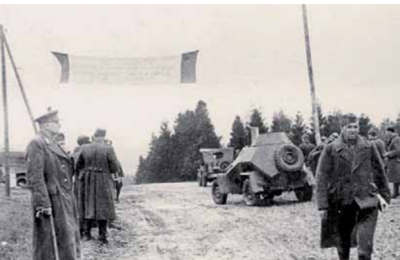
Brigádní generál Ludvík Svoboda (vlevo) přihlíží postupu jednotek přes Dukelský průsmyk na čs. území.

rozvíjení útoku nevýhodný a prosto se čs. jednotky po vystřídání 5. října vrátily zpět na směr proti Dukelskému průsmyku. Na základě výpovědi německého zajatce zadrženého v noci z 5. na 6. října poblíž Barwinku bylo možné soudit, že se nepřítel hodlá ze svých otřesených pozic na průsmyku stáhnout. Proto velení obou brigád vyslalo několik průzkumných hlídek, které by zjistily skutečný stav věcí. Jako první pronikla na hranici hlídka 2. pěšího praporu pod velením četaře Vasila Nebijlaka a zjistila, že Němci skutečně ustupují. Proto 1. čs. sbor ihned zahájil pronásledování a osvobodil první slovenskou obec Vyšný Komárnik. Němci před ústupem ale nastrožili četné miny, jejichž obětí se stal i velitel 1. čs. brigády brigádní generál Jaroslav Vedral-Sázavský.