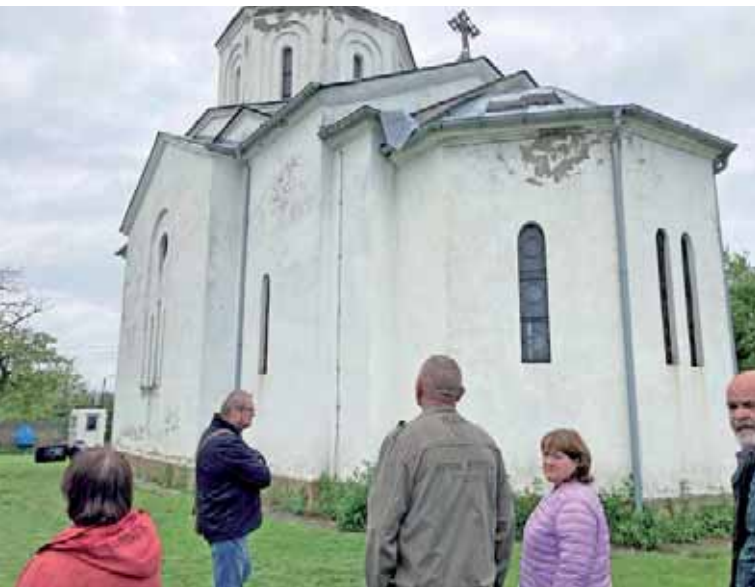
Pravoslavný kostel v Podujevu rozbořil a vypálil dav výtržníků při etnických nepokojích v březnu 2004. Poškozený kostel se zvonící a plotem byl opraven, ale jinak celý objekt chátrá.

V Podujevu, které je správním střediskem oblasti zvané Besiana a Llapi jsme si prohlédli pravoslavný kostel stojící nad městem. Při etnických čistkách v březnu 2004 byl značně poškozen a vypálen. Celý areál byl později místními orgány opraven a hlídá ho policie. Dovnitř nás pustili po předložení pasu a zapsali si nás do návštěvní knihy.