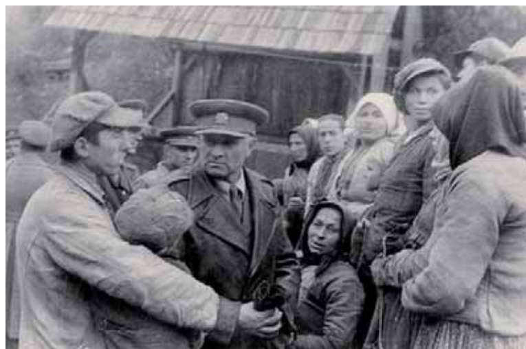
Brigádní generál Ludvík Svoboda s obyvateli první osvobozené obce Vyšný Komárnik.

Dne 6. října vojáci 1. čs. armádního sboru postoupili několik kilometrů za hranice. Pak je zastavily nové nepřátelské linie, vytvořené jižně od vesnice Nižní Komárnik a chráněné od východu postaveními na vrcholech hor Obšár (kóta 532) a Sovárna (kóta 529), od západu pak bezejmennou výšinou (dnes kóta 539 Prokopec). Veškeré další snahy o další průnik údolím potoka Ladomirka k vesnici Krajná Poľana se nesetkaly s výraznějším ziskem, pouze se podařilo potupit v oblasti hory Sovárna, za kterou se však opět nacházela další německá postavení. Velitel 38. armády se ve druhé polovině října pokusil na základě jistého úspěchu sovětské 359. střelecké divize přenést těžiště útoku 1. čs. brigády do oblasti hory Hrabov (kóta 517), nicméně i zde se postup měřil pouze na stovky metrů. Poslední větší útok karpatsko-dukelské operace generálplukovník Moskalenko zorganizoval 25. října, když zaútočil oslabeným 67. střeleckým sborem s podporou asi tří desítek